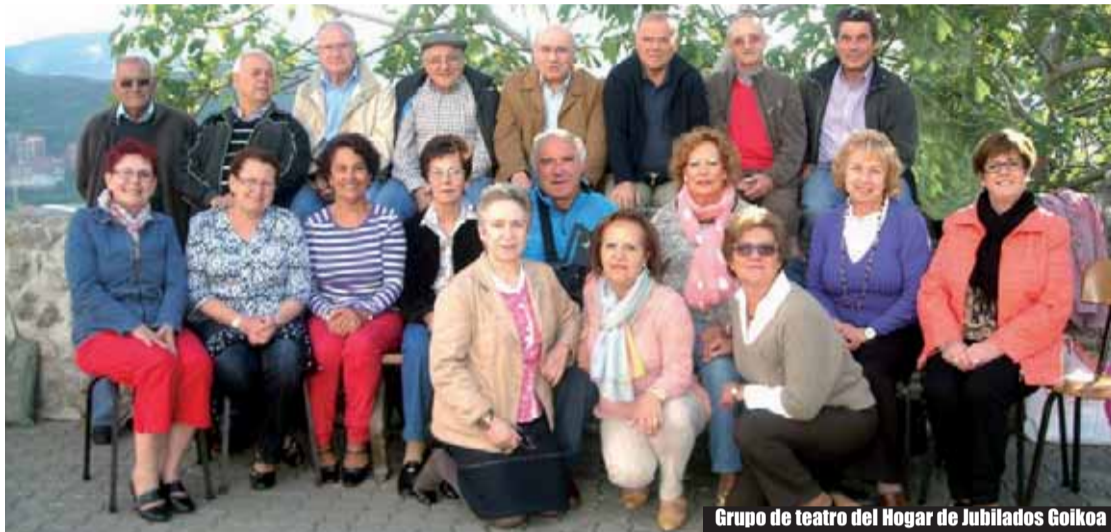
Grupo de teatro del Hogar de Jubilados Goikoa

ni organización, corre a cargo del vecindario, invitados del vecindario, familiares lejanos que se acercan, cercanos que también se acercan y gentes en general. De uno y otro lado de la BI-634 que para eso funciona el EtxebarriBus en jaiak. La diversión –dicen los que han diseñado el programa que aún está por pulirse del todo– “la pondremos entre tod@s”.