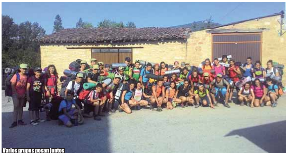
Varios grupos posan juntos