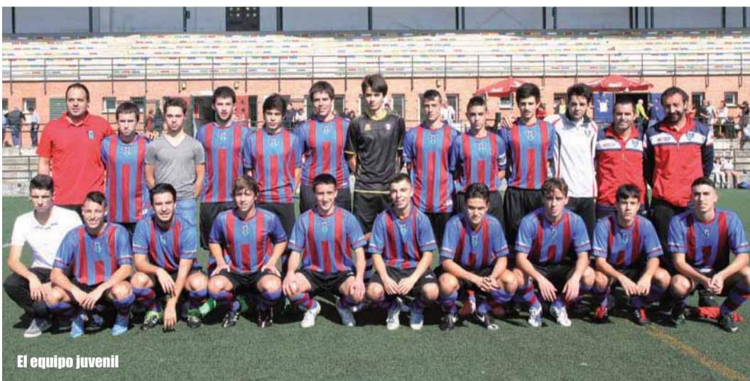
El equipo juvenil

"Estoy muy contento con este gran inicio de temporada que me da fuerzas para luchar por lo más alto en las siguientes pruebas del calendario", señaló el piloto del equipo de motocross Yelco Team.