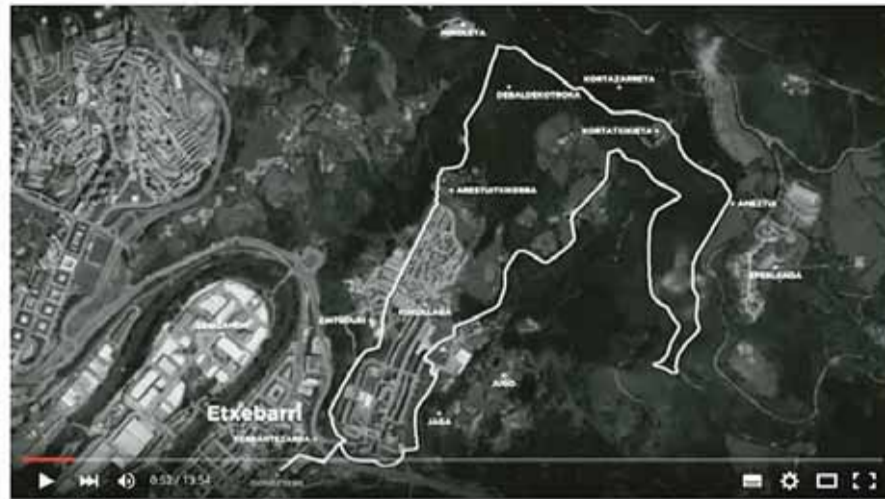
Etxebarri: Kukullaga - Zintuduri - Kortazarreta - Ameztui, Zuztarretatik oinez