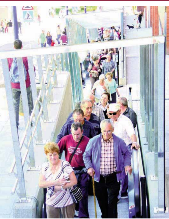
Etxebarri 'liquida' sus rampas mecánicas

Los Udalekus empiezan en abril con la apertura del plazo de inscripciones