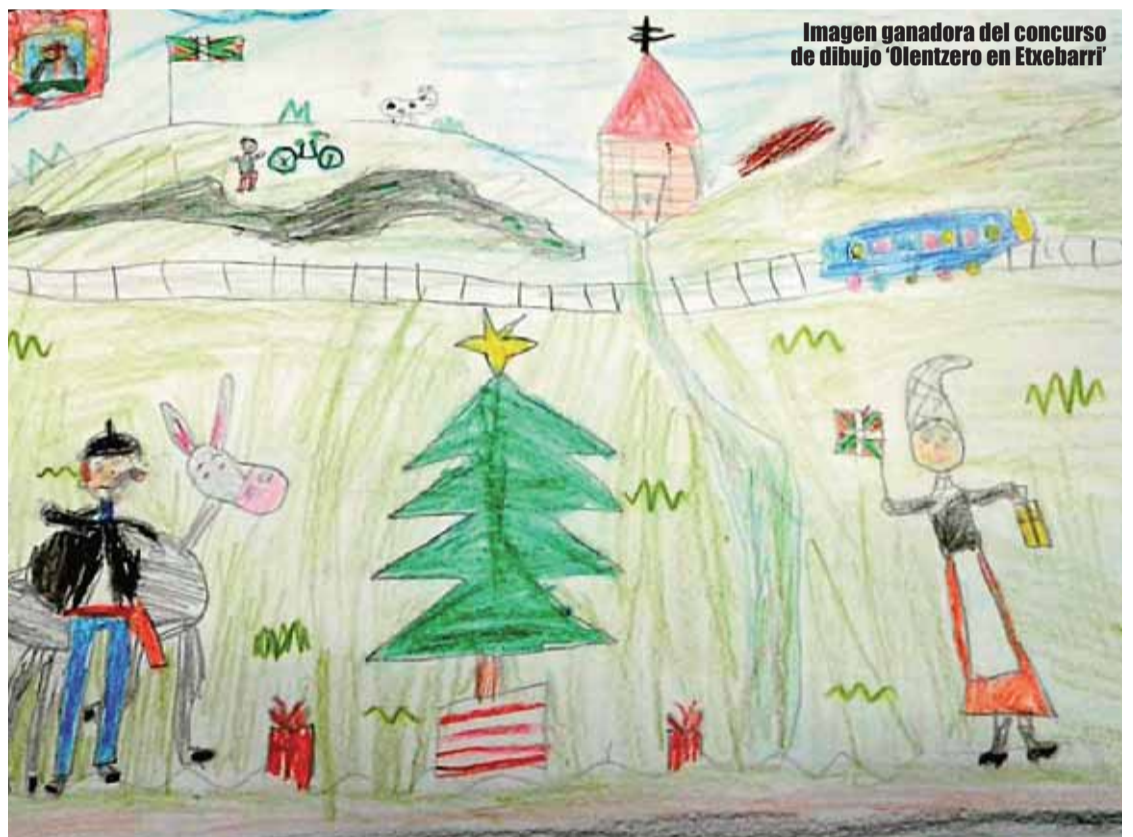
Imagen ganadora del concurso de dibujo 'Olentzero en Etxebarri'

Etxebarri supera la barrera de los 12 millones de euros en su presupuesto local para 2019