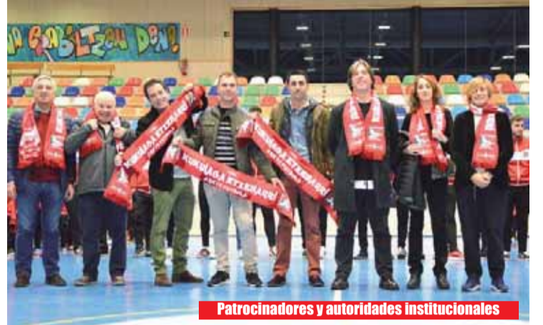
Patrocinadores y autoridades institucionales