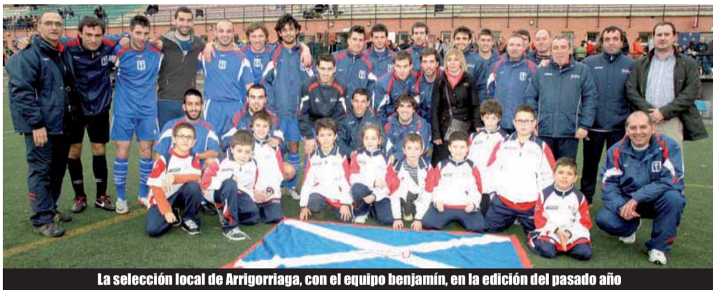
La selección local de Arrigorriaga, con el equipo benjamín, en la edición del pasado año

y los de Arrigorriaga consiguieron 6 medallas de oro, 3 de plata y 5 de bronce.