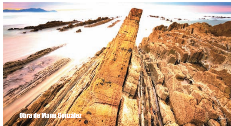
Obra de Manu González

El resto de la historia es toda una cadena de favores. "Yo contacto con el subdirector del Hospital de Basurto que tiene un hijo entrenando en el 'Club Atle-