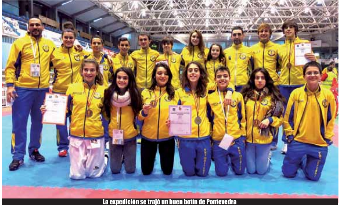
La expedición se trajo un buen botín de Pontevedra

más activos trabajan ahora en la organización del próximo campeonato de Europa que se celebrará en 2015, en Zumarraga, en el que también competirá, con 64 años. "Y en el open internacional de Euskadi que organizamos cada año, en el mes de julio".