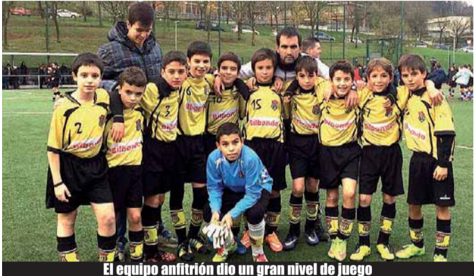
El equipo anfitrión dio un gran nivel de juego