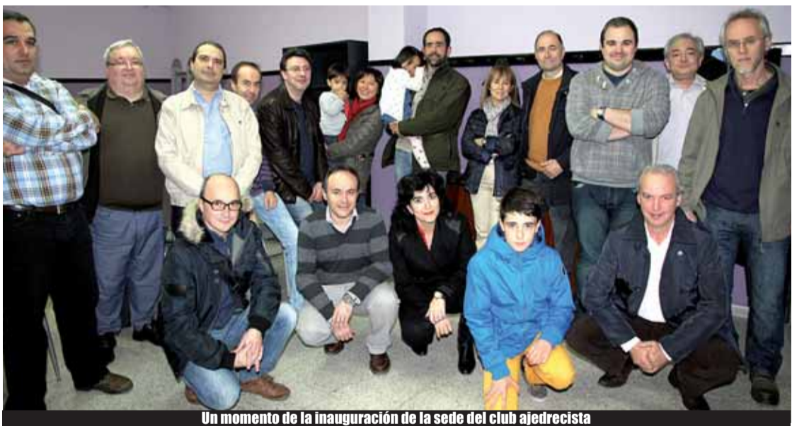
Un momento de la inauguración de la sede del club ajedrecista