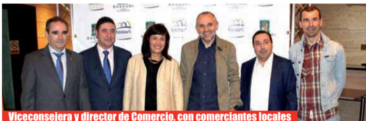
Viceconsejera y director de Comercio, con comerciantes locales