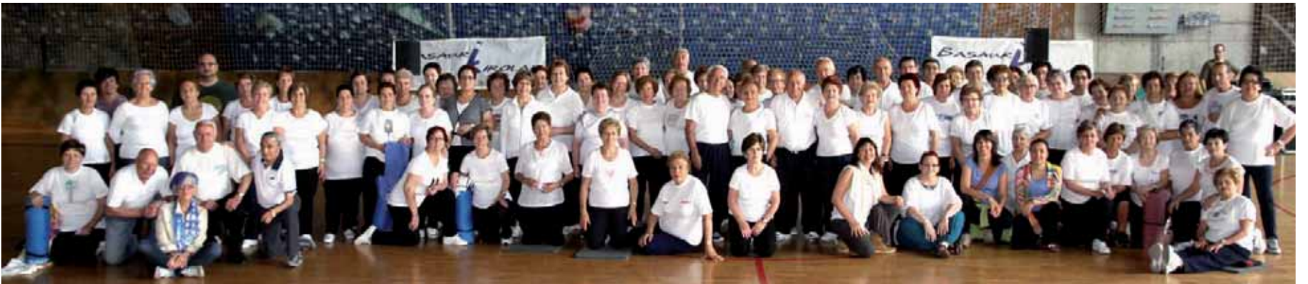
El Polideportivo Artunduaga de Basauri acogió el pasado viernes la clausura de la temporada de Deporte para la Tercera Edad que durante todo el año vienen desarrollando en las Kultur Etxea y Residencias del municipio, organizado desde el Ayuntamiento.