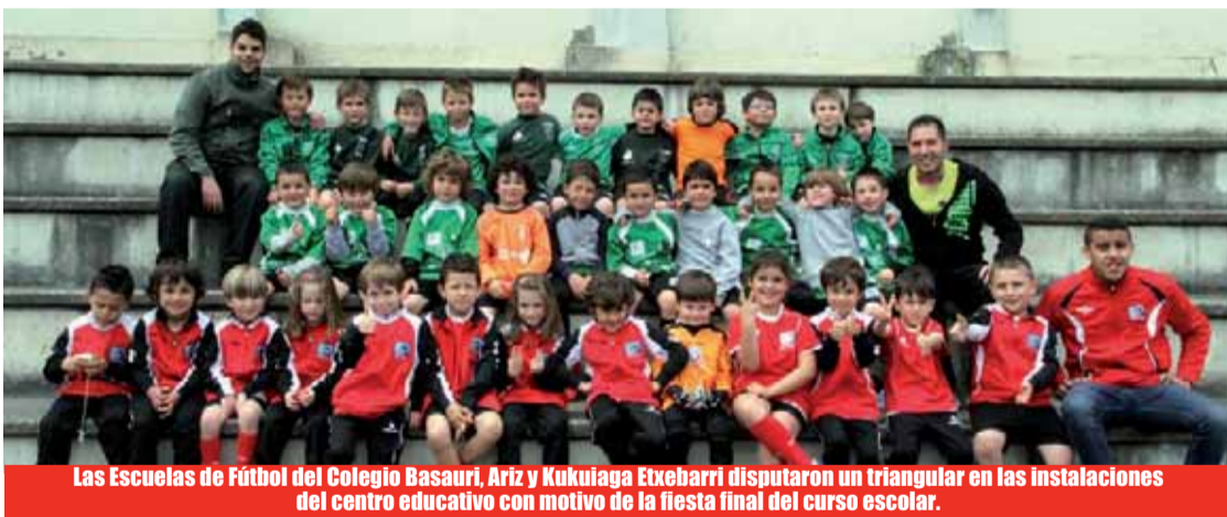
Las Escuelas de Fútbol del Colegio Basauri, Ariz y Kukuiaga Etxebarri disputaron un triangular en las instalaciones del centro educativo con motivo de la fiesta final del curso escolar.

El Athletic se llevó la IV edición del torneo alevín tras imponerse por 7-6 al Danok Bat. La competición reunió a equipos de Bizkaia, Cantabria, Asturias, Vitoria o Valladolid.