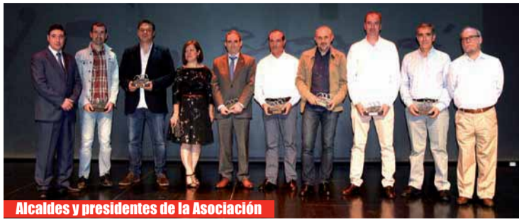
Alcaldes y presidentes de la Asociación

El sábado 6 de junio, se organizó un concierto con For-