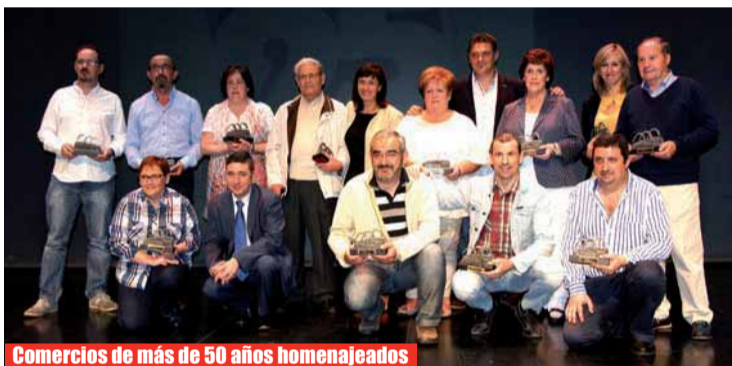
Comercios de más de 50 años homenajeados