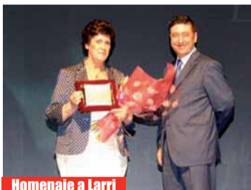
Homenaje a Larri

mula V, "con la intención de ampliar el agradecimiento a los y las basauritarras por su continuado apoyo. Desde la Asociación somos conscientes de que el comercio y la hostelería no viven si no hay una clientela detrás", apuntaban desde la ACB.