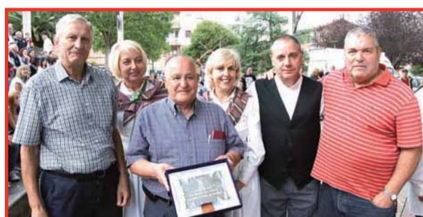
Imágenes de las SanMigelgo jaiak