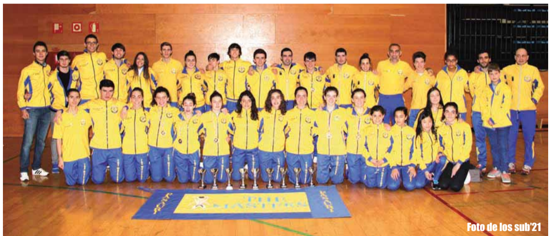
Foto de los sub'21