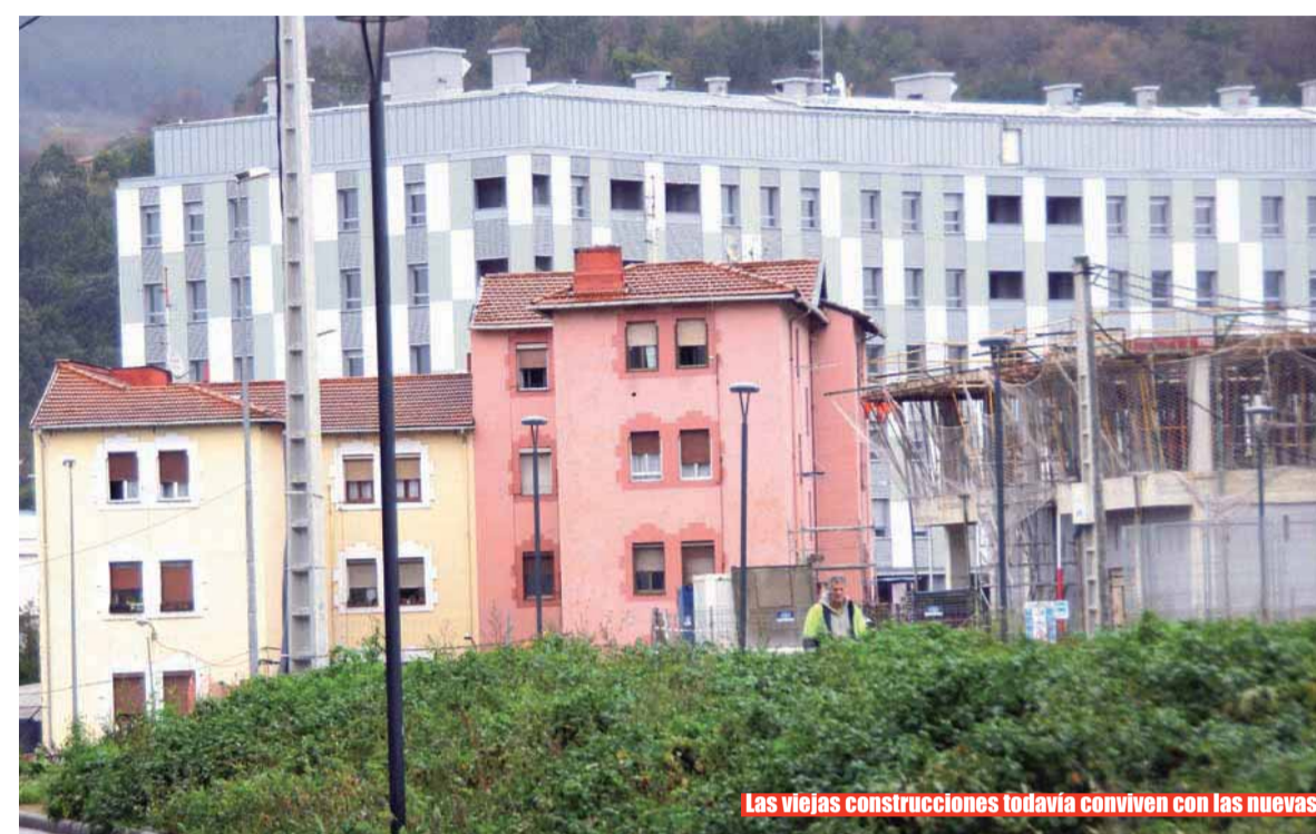
Las viejas construcciones todavía conviven con las nuevas

Este segundo bloque se enmarca en el Plan Director de Vivienda 2013-2016 del Departamento. Mejorado en Basauri por el acuerdo firmado el pasado año entre el Ayuntamiento de Basauri y Gobierno Vasco, "que destina al alquiler social un alto porcentaje de las actuaciones inmediatas previstas en el municipio, como esta de Sarratu y las del área de Azbarren,