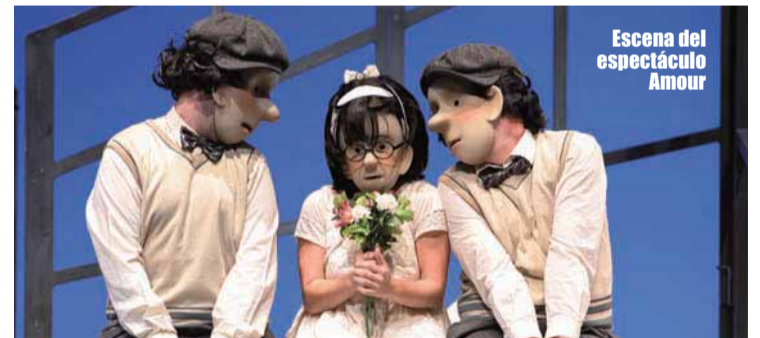
Escena del espectáculo Amour

teatral en alza. Desde su creación en 2008 hasta hoy, la compañía no ha parado de crear espectáculos de gran calidad hasta situarse como una de las principales compañías de artes escénicas centradas en el público familiar. Han realizado giras internacionales en Francia, Holanda y Estados Unidos, donde