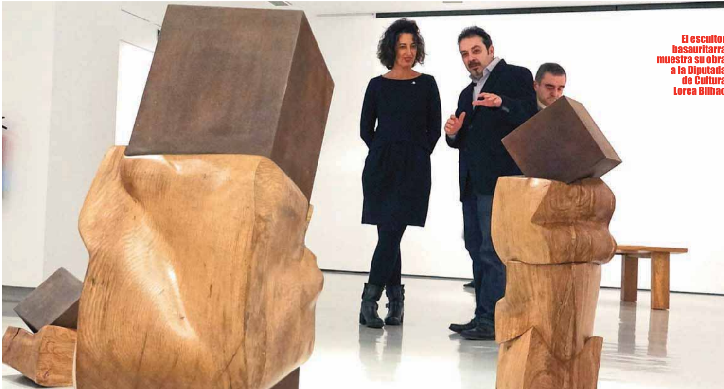
El escultor basauritarra muestra su obra a la Diputada de Cultura Lorea Bilbao