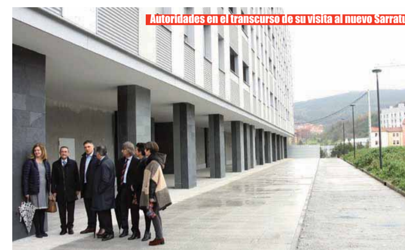
Autoridades en el transcurso de su visita al nuevo Sarratu

Cinco de estas familias han optado por adquirir viviendas en el