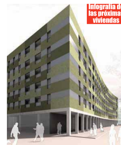
Infografía de las próximas viviendas

bloque de 60 viviendas en régimen de venta. 40 de las familias afectadas han elegido acceder mediante compra a las viviendas del segundo bloque de 90 pisos, y las 10 restantes han decidido realojarse en este segundo bloque. O lo que es lo mismo, Alokabide ya tiene destinadas 50 de las 90 viviendas del edificio destinado al alquiler social para los anteriores habitantes de Sarratu. Los precios de venta de estas viviendas para las personas de realojo van desde los 59.834 euros a los 127.240 euros.