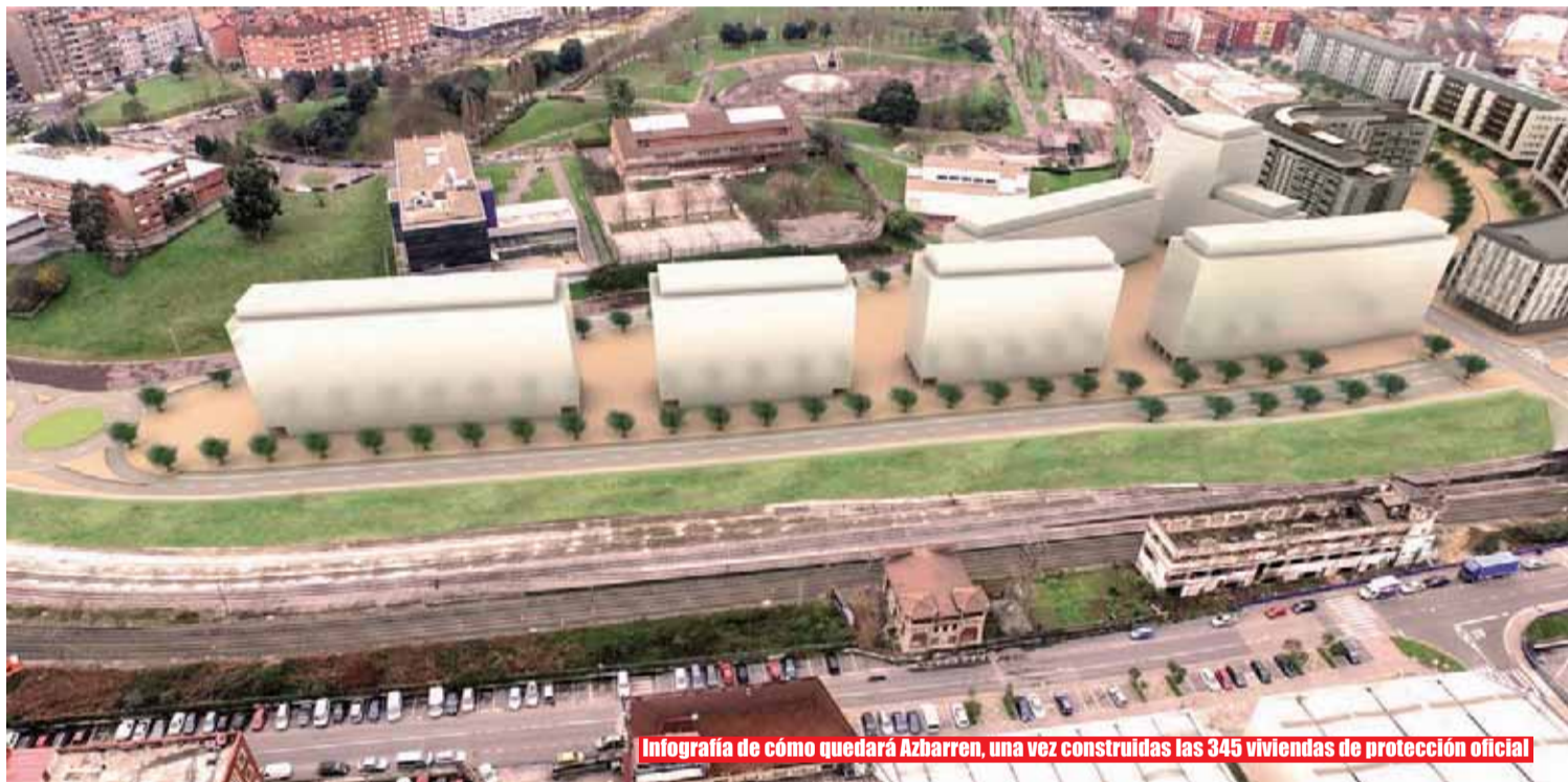
Infografía de cómo quedará Azbarren, una vez construidas las 345 viviendas de protección oficial