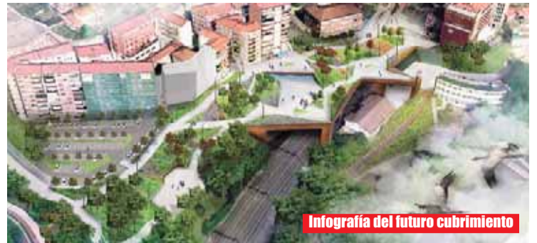
Infografía del futuro cubrimiento

La intervención se desarrollaría por fases con un plazo de ejecución de un año.