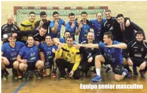
Equipo senior masculino

Este año no se clasificarán directamente los dos primeros de cada fase que se juegue. Serán el campeón de cada grupo más los tres mejores segundos de los 6 grupos, por lo que estará mucho más difícil conseguir esta ansiada plaza.