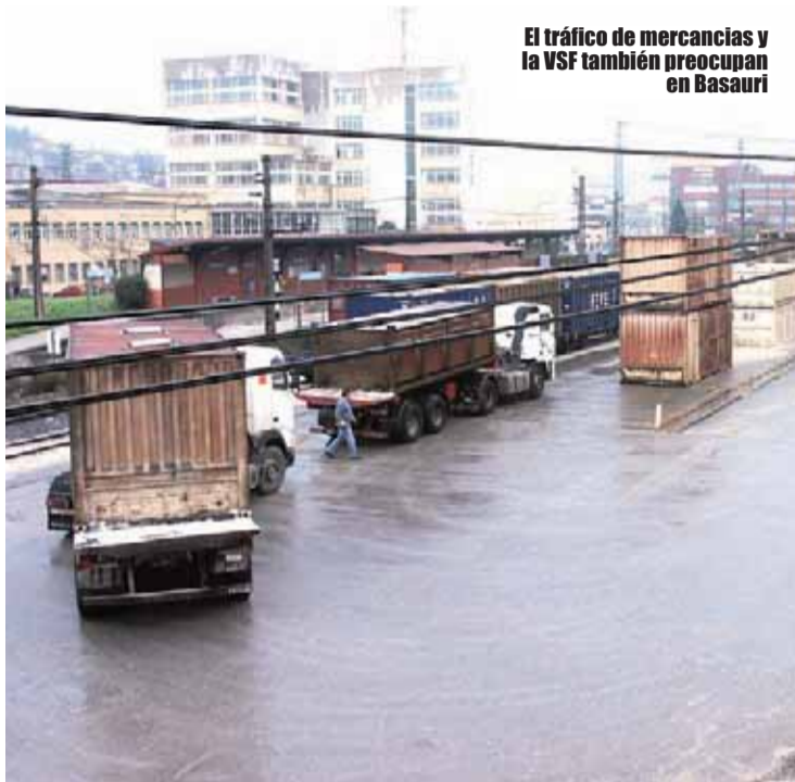
El tráfico de mercancías y la VSF también preocupan en Basauri

Este nuevo documento compromete al Ministerio de Fomento y a Adif a cumplir con unos plazos, unas inversiones y unos importes económicos concretos.