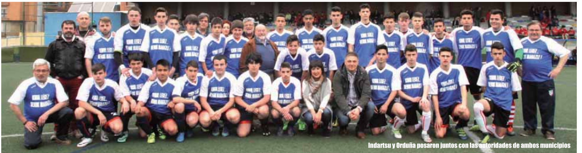
Indartsu y Orduña posaron juntos con las autoridades de ambos municipios