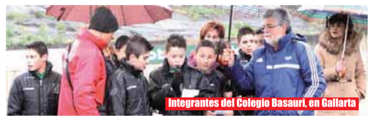
Integrantes del Colegio Basauri, en Gallarta

padres, madres, jugadores y árbitros salieron al campo unidos por un bien común, como es erradicar cualquier acción violenta que se pueda vivir en un terreno de juego. Todos deseamos que el ejemplo cunda y se expanda por el bien común.