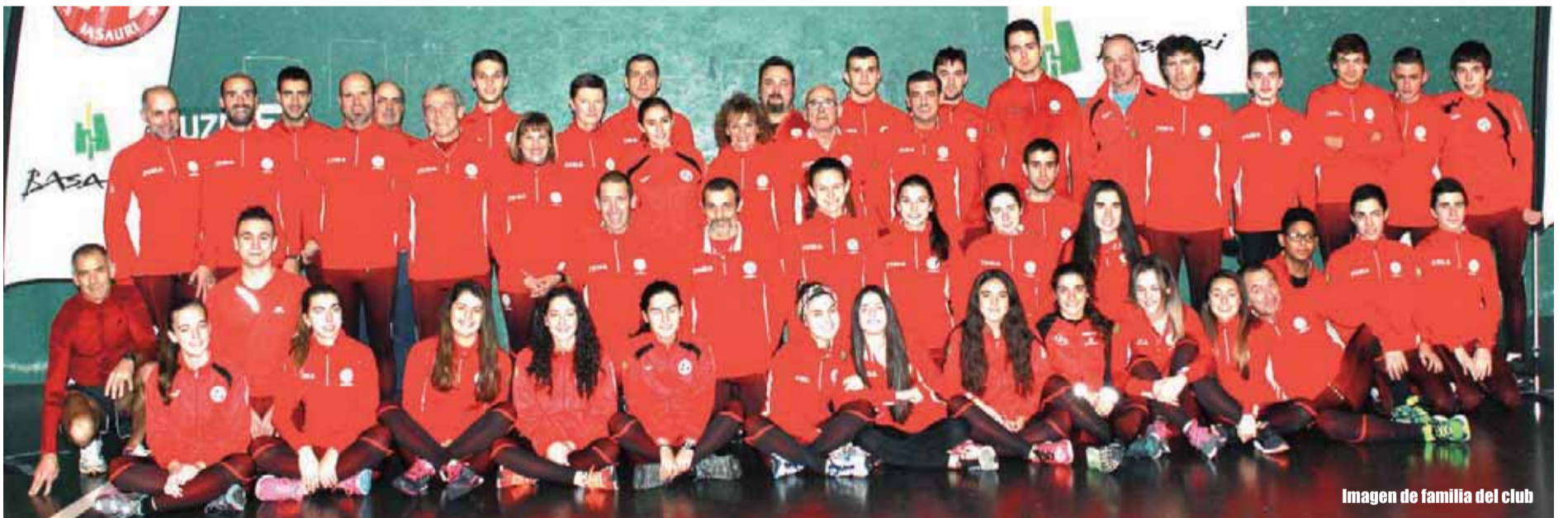
Imagen de familia del club