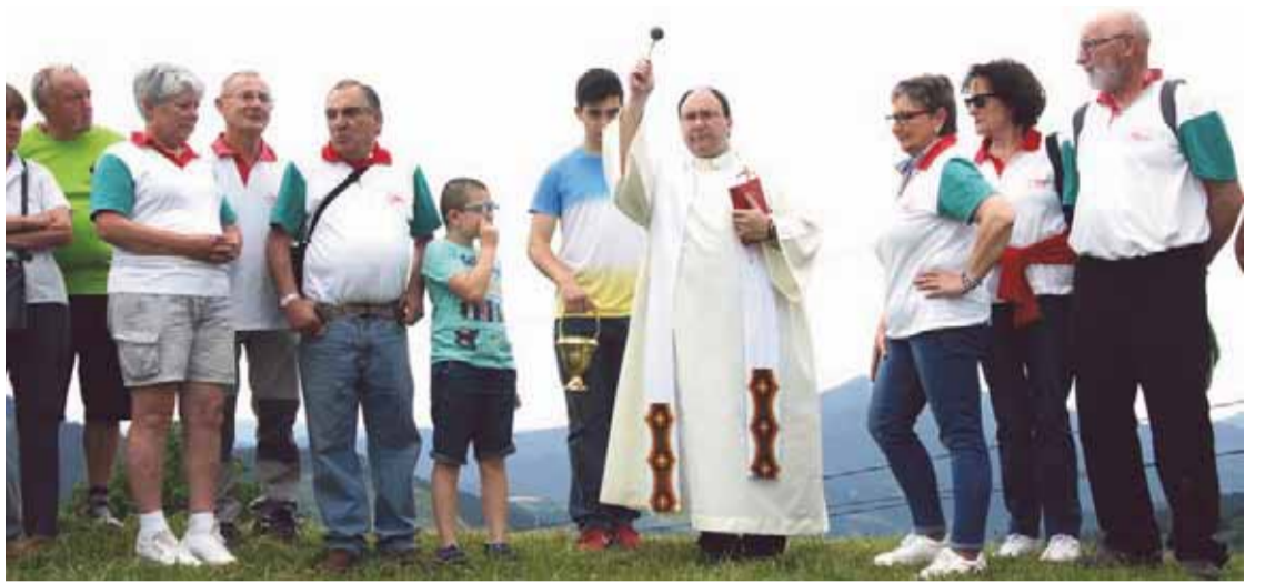
imagen que hoy en día, en el mes de noviembre, es objeto de procesión. "También fue gracias