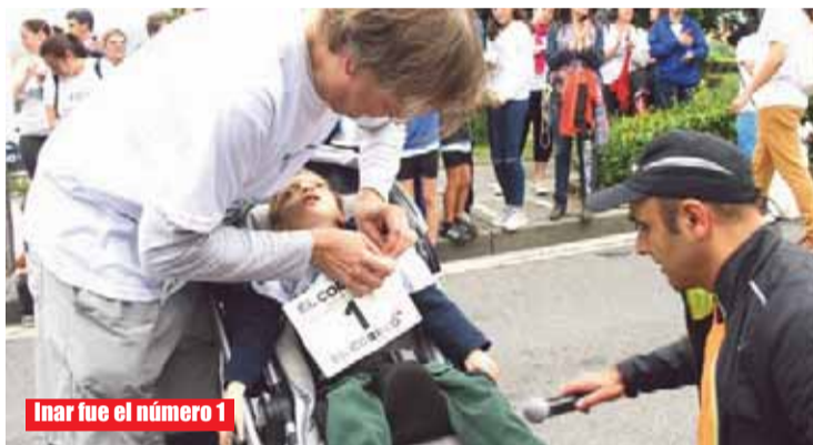
Inar fue el número 1