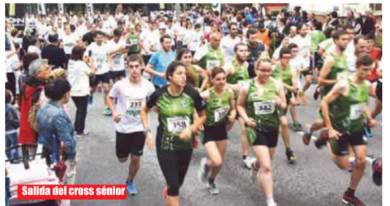
Salida del cross sénior

kolaris anónimos merecieron el calificativo de “auténticos txapeldunes” por parte de la orga-