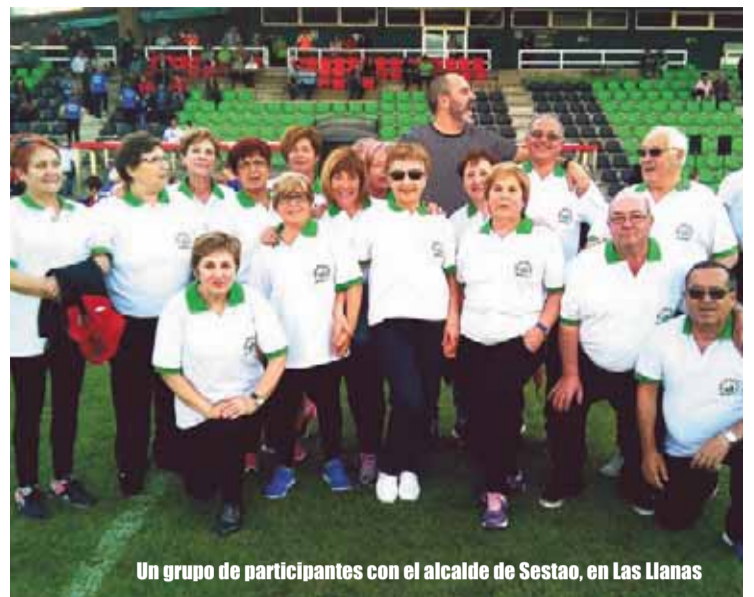
Un grupo de participantes con el alcalde de Sestao, en Las Llanas

La cita atlética arrancará a partir de las once de la mañana y en la misma se darán cita nueve clubes tanto vascos como cántabros. Se espera la presencia de atletas del Hiru Herri, Ardoi, Durango, Galdakao, Portugalete, Castro, Piélagos, Torrelavega y el anfitrión.