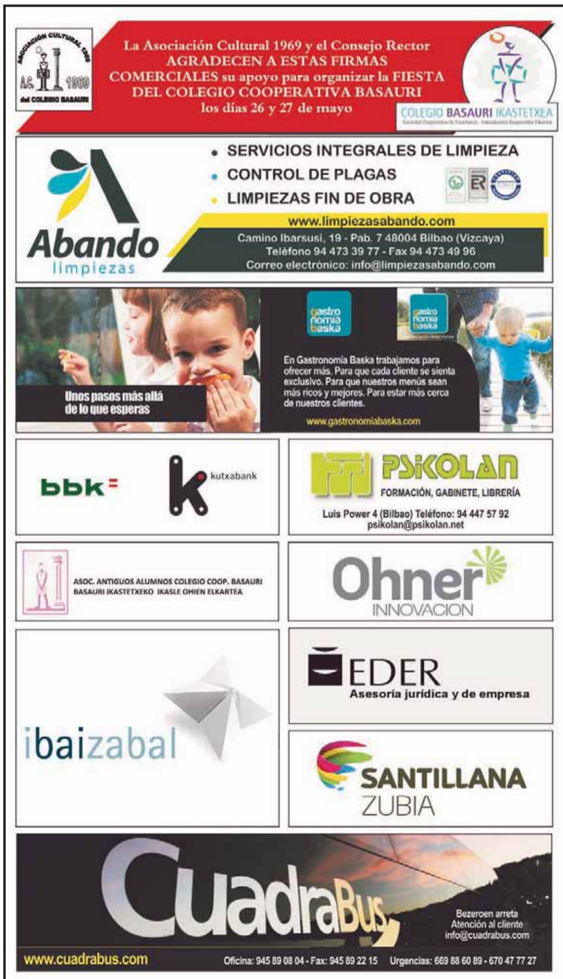
Imagen de archivo