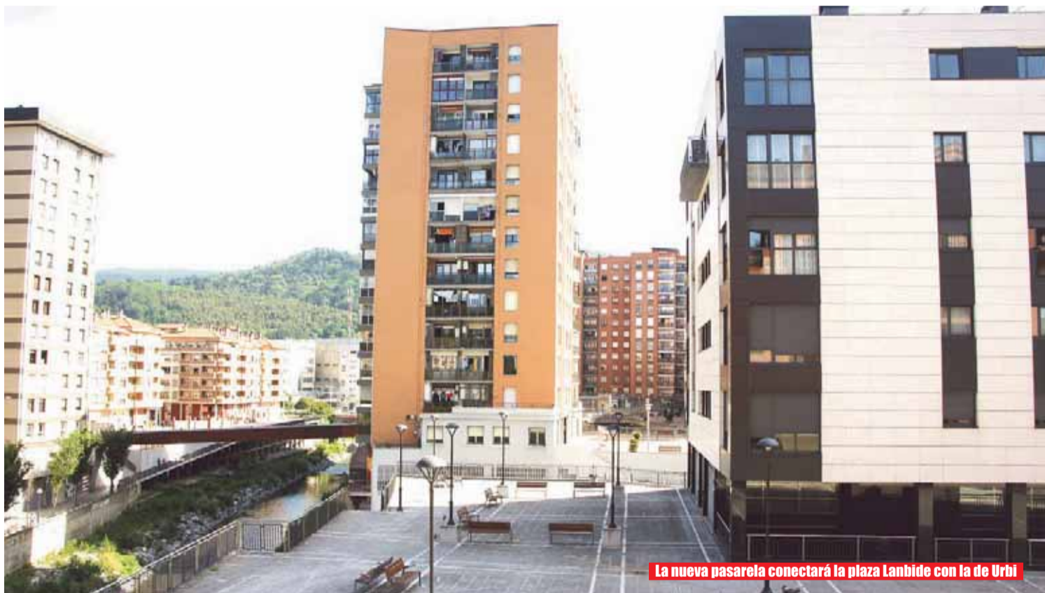
La nueva pasarela conectará la plaza Lanbide con la de Urbi

de la Casa de los Maestros de Arizgoiti a fin de evitar posibles caídas de pequeños fragmentos del tejado (12.220€) y asfaltar un tramo del bidegorri de Karmelo Torre que presenta cierto grado de deterioro (28.200€).