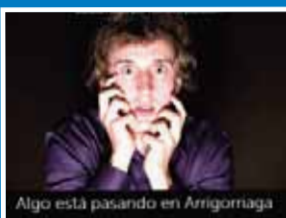
Algo está pasando en Arrigorriaga

'Paregabea', el vídeo que muestra una Arrigorriaga sin par, ronda las 4.000 visitas