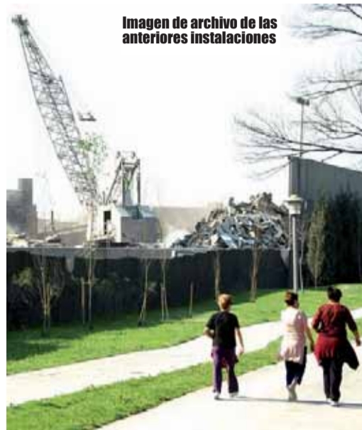
Imagen de archivo de las anteriores instalaciones

“Tras nuestra petición de adopción de medidas se nos contestó que se habían puesto medidas por parte de la empresa para paliar la situación de expulsión de escorias: nos dijeron que se había alejado la zona de enfriamiento de escoria blanca del paseo todo lo posible, situándola en el extremo opuesto del área. Que se había instalado una plataforma elevada para que circulen por ella los vehículos portaconos, evitando que éstos tengan que pasar por el interior de la zona de escorias y levanten polvo al hacerlo. Y que la zona de volcado de escorias blancas se había