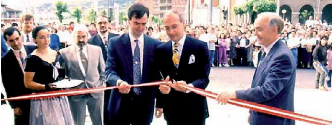
Imágenes de archivo de la inauguración el 29 de mayo de 1993