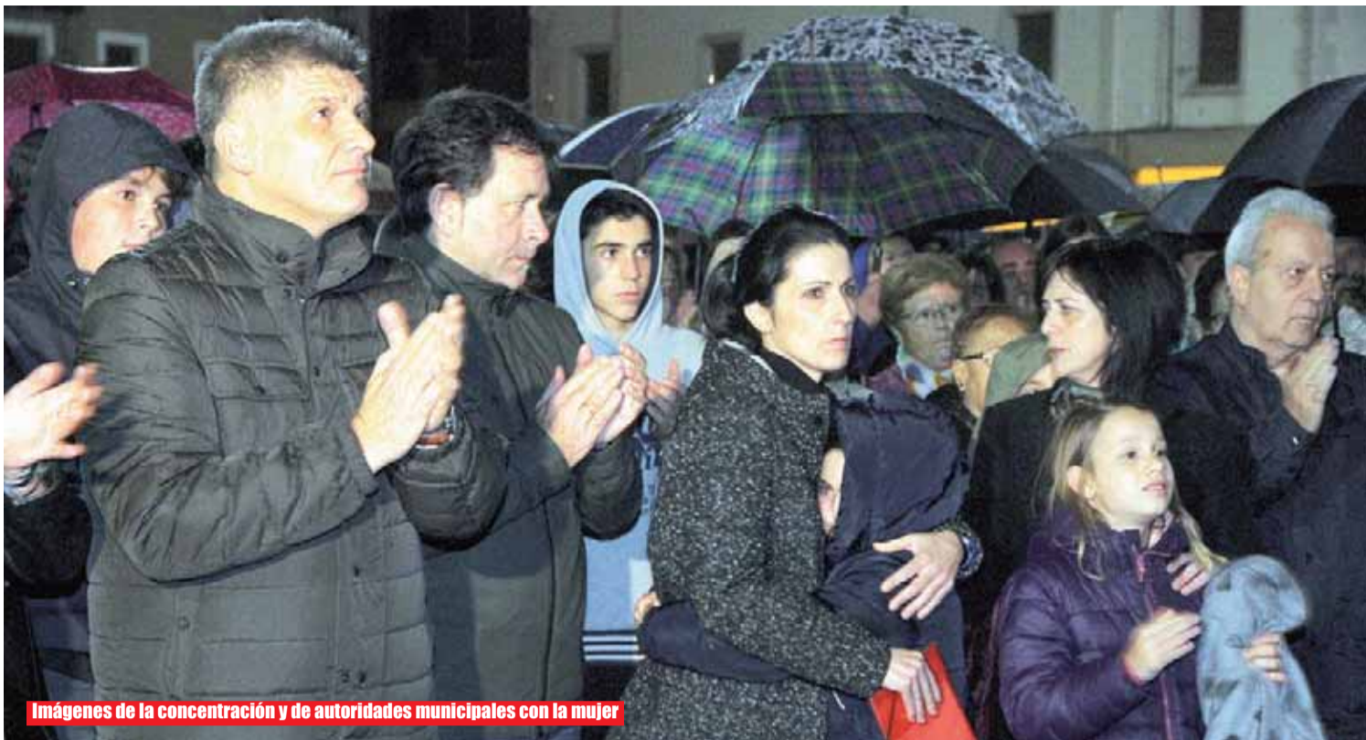
Imágenes de la concentración y de autoridades municipales con la mujer