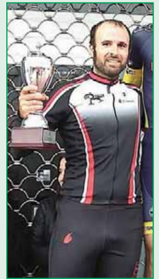
Basroller se sube al podium absoluto en la media maratón roller de Getxo