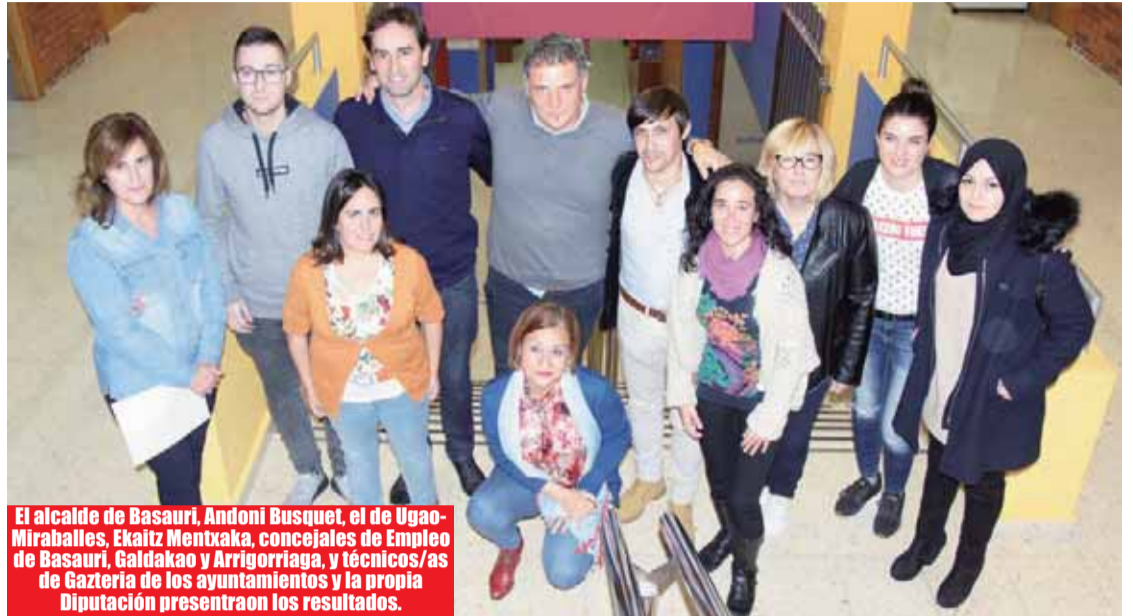
El alcalde de Basauri, Andoni Busquet, el de Ugao-Miraballes, Ekaitz Mentxaka, concejales de Empleo de Basauri, Galdakao y Arrigorriaga, y técnicos/as de Gazteria de los ayuntamientos y la propia Diputación presentaron los resultados.

Posteriormente, estos ocho jóvenes han tomado parte en una formación práctica en puesto de trabajo. El 50% de ellos/as (4 personas) han conseguido un