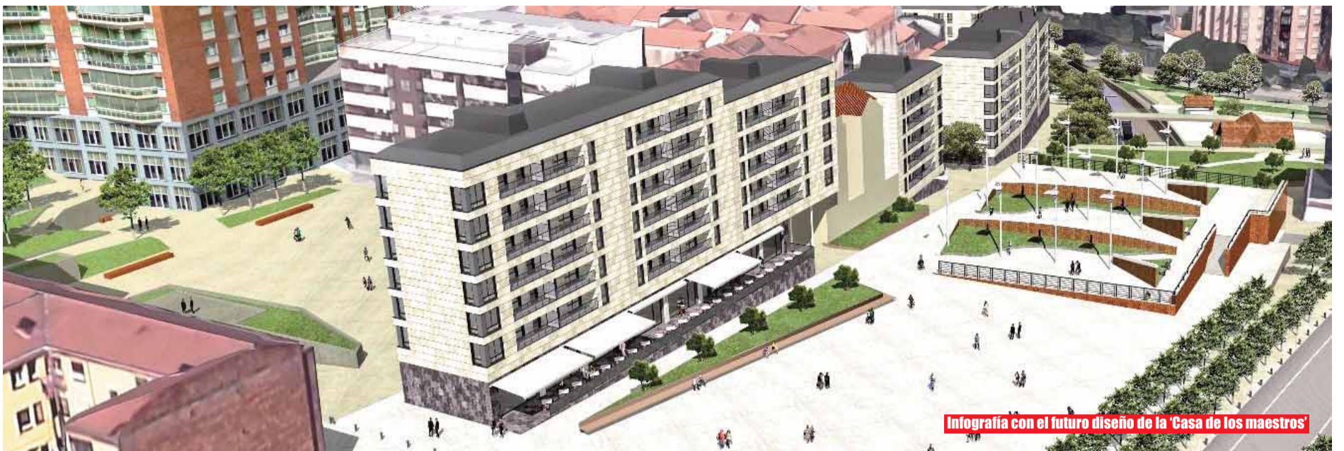
Infografía con el futuro diseño de la 'Casa de los maestros'