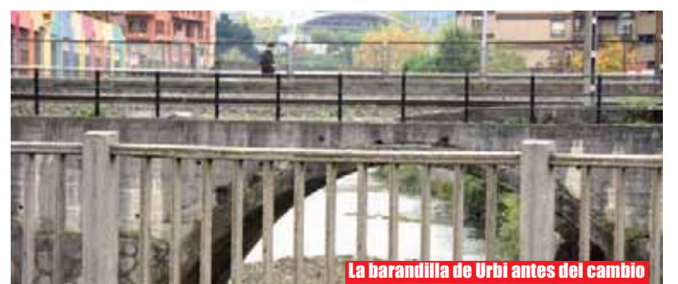
La barandilla de Urbi antes del cambio

La pasarela peatonal paralela a la línea de Euskotren que cruza el río Nerbioi uniendo los barrios de Ariz, desde el parque Cantabria, y de Urbi tiene como elemento de protección una barandilla de acero inoxidable con barrotes horizontales que