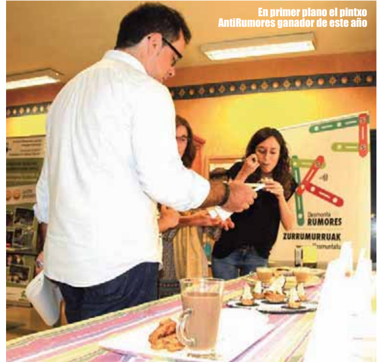
En primer plano el pintxo AntiRumores ganador de este año

Esta iniciativa arrancaba a finales del 2016 y a lo largo de estos dos años se ha ido dando a conocer poco a poco entre la ciudadanía y el tejido asociativo. Entre las acciones realizadas caben destacar colaboraciones con CEPA de Basauri (Bibliotecas humanas), Instituto de Formación Profesional Básica de