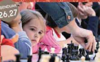
Haurrentzako xake txapelketa Campeonato infantil de ajedrez Endroke xake elkartea