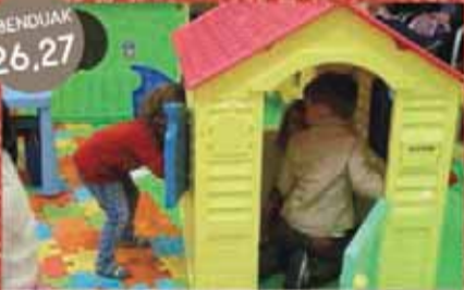
Umeen gabonetako parkea - Txikiak Puzgarria, ludoteka, tailerrak Parque infantil de Navidad - Peques Hinchable, ludoteca, talleres