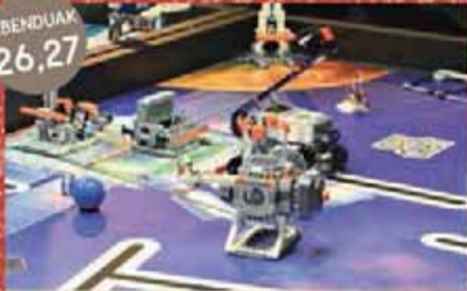
Robotika eta programazio tailerrak (Izen ematea: Abenduak 2-10) Talleres de robótica y programación (Inscripción: 2-10 diciembre)

7-9 urte 7-9 años 10.30 - 13.30 10-14 urte 10-14 años 16.30 - 19.30