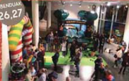
Umeen gabonetako parkea - Ertainak Puzgarria, bideojokoak, tailerrak Parque infantil de Navidad - Median@s Hinchable, videojuegos, talleres