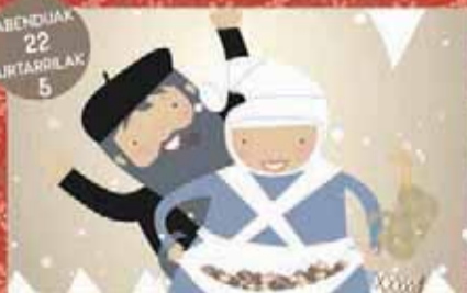
Olentzeroren postaria, dantzak, zinema, Erregeen kabalgata... Cartas al Olentzero, bailes, cine, cabalgata de Reyes... Abusu auzo-elkartea, Ollargan auzo-elkartea, Bolintxu

Abusu eta Ollargan auzoan / Barrio de Abusu y Ollargan