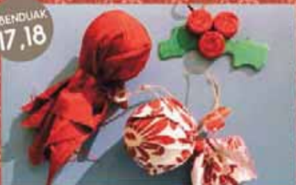
Gabonetako araingarrien tailerrak Talleres de adornos navideños