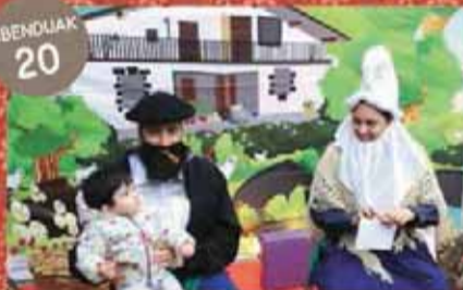
Olentzeroren etxea - Gutunak eta tailerrak Casa del Olentzero - Cartas y talleres