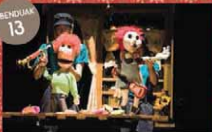
"KONTUKANTARI" Antzerkia Teatro "KONTUKANTARI" (Laenanagananja)