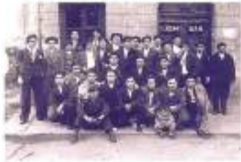
Bar 'El Riojano'. 1933. Autor desconocido