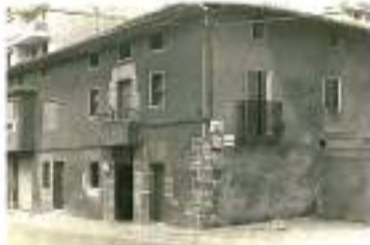
Bar José Mari en Abaroa. Años 50. Autor desconocido