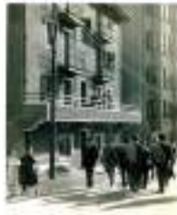
Taberna Juan Martín. 1946. Autor desconocido