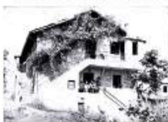
Txakoli Ambe Behekoa en Uriarte. Autor desconocido