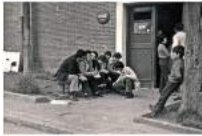
Bar en calle Garbíeku. Autor desconocido