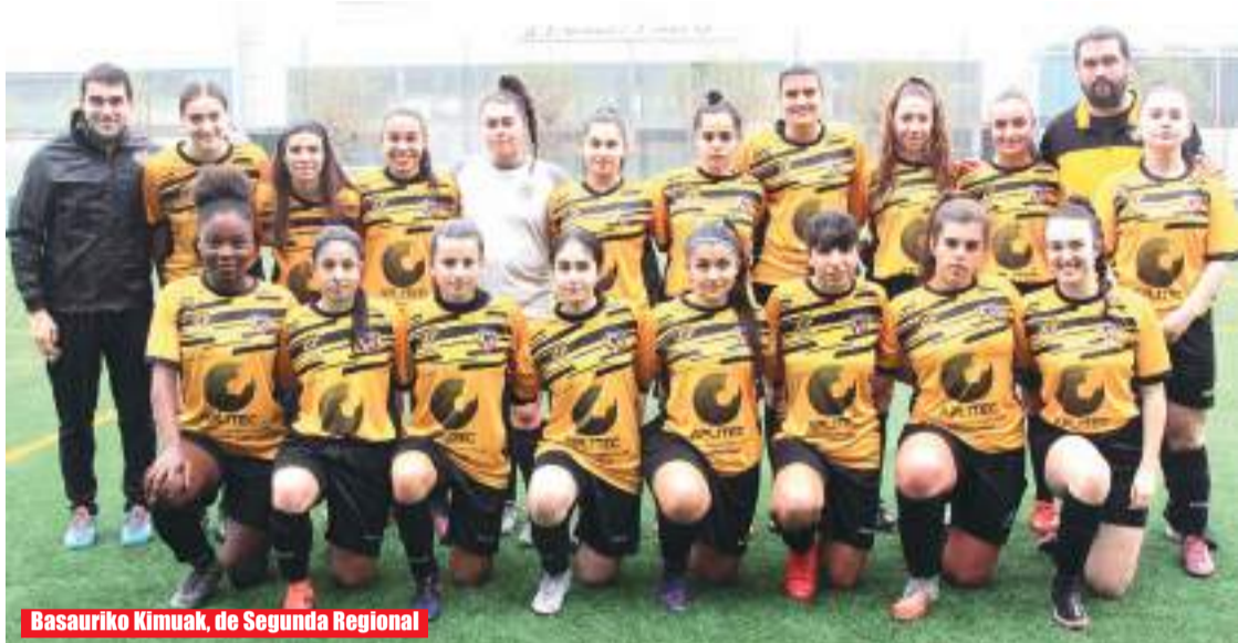
Basauriko Kimuak, de Segunda Regional

Mientras, el filial, que cuenta con dos años de vida, ha logrado el ascenso a Primera regional, lo que sin duda redundará en beneficio de la competitividad de todo el club. “Desde el principio nos pusimos la tarea de ascender esta temporada. Sabíamos que teníamos un